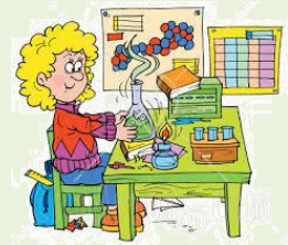
Tabela 11: Naravoslovni dnevi 2023/24

Učenke in učenci aktivno in sistematično dopolnjujejo in poglobljajo teoretično znanje, ki so ga pridobili med rednim poukom, in ga povezujejo v nove kombinacije. Dejavnosti jih spodbujajo k samostojnemu in kritičnemu mišljenju, omogočajo uporabo znanja ter spoznavanje novih metod in tehnik raziskovalnega dela.