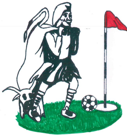
Slika 10: Osnutek logotipa

Za oznako našega produkta smo pripravili tudi osnutek logotipa, ki prikazuje perzijskega boga Mitra, boga sonca in ga najdemo tudi v hajdinskem občinskem grbu. Ker smo kamp poimenovali Mitrin footgolf kamp , se nam je izdelala odlična ideja, da povežemo nekaj že obstoječega in nekaj novega, ki prikazuje občino, turizem ter doda športno noto.