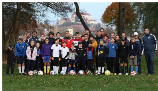
Slika 2: Skupinska slika hajdinskih učencev s starši na footgolf igrišču