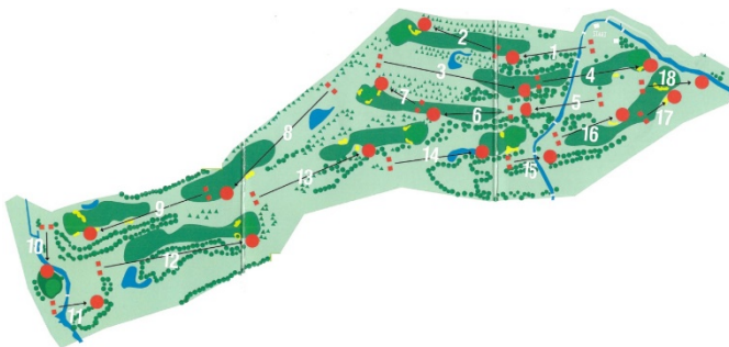
Slika 3: Igrišče za footgolf (golf) Ptuj

Footgolf je nov šport v Sloveniji in je mešanica nogometa ter golfa. Tako kot golf tudi igra footgolfa poteka na igrišču, namenjeno golfu, s prav toliko luknjami. Cilj igre je spraviti nogometno žogo s čim manj udarci v luknjo. Za razliko od golfa pri tem športu udarjamo žogo z nogo namesto s palico. Igra v naravi je izjemna priložnost za golf igrišča, da na urejene zelenice privede novo športno ciljno skupino v nadvse zanimivih retro oblačilih.