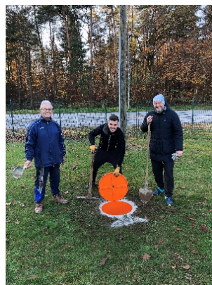
Slika 1: Postavitev footgolf luknje v Športnem parku Gerečja vas