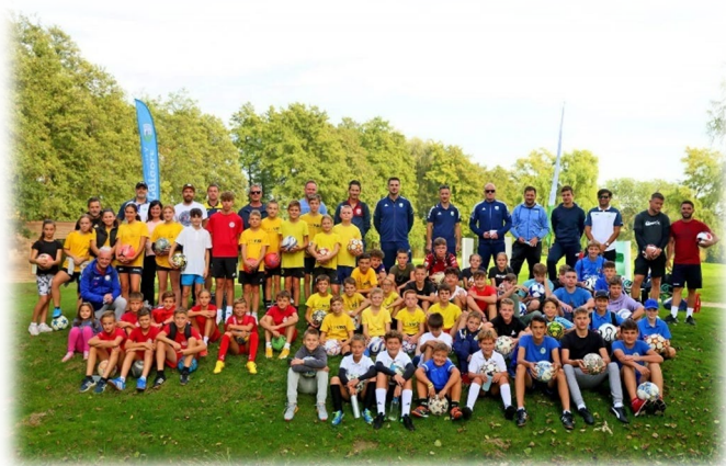
Slika 9: Udeleženci enega od treningov footgolfa

Želimo si, da takšne in še številčnejše slike nastanejo tudi na našem kampu.